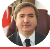
VALİ HAMZA AYDOĞDU